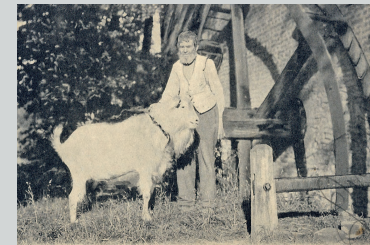
Unterschlächtige Olligsmühle westlich Sinthern, seit etwa 1920 Woltersmühle Postkarte von 1904

Die Wassermühlen am Pulheimer Bach wurden überwiegend ober-schlächtig betrieben. Das heißt, das Antriebswasser ("Aufschlagwasser") wurde von oben auf das Mühlrad geführt. Um die Höhe zu erreichen, musste ein Mühlenkanal in den Hang gelegt werden. Fünf Mühlen am Pulheimer Bach wurden auf diese Weise genutzt.