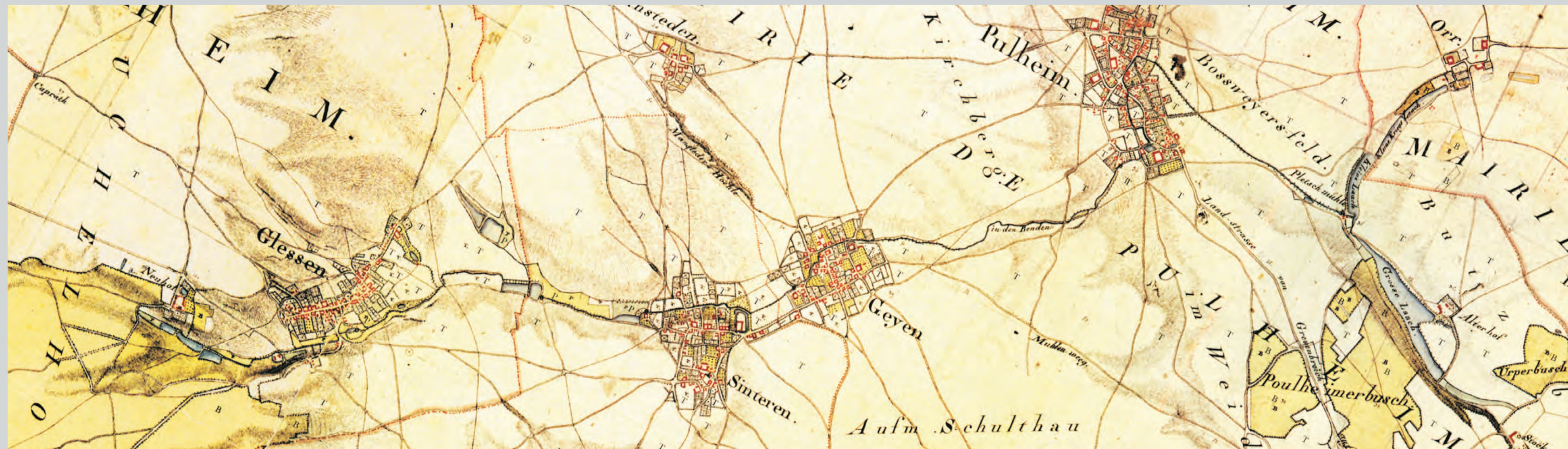
Topographische Aufnahme der Rheinlande durch Tranchot und v. Müffling (1803–1828) Zusammenschritt der Blätter 61 Hackenbroich, 70 Bergheim, 71 Lövenich

Vor der Erfindung von Dampfmaschine und Elektrizität nutzte der Mensch vor allem die Kraft von Wind und Wasser, um Maschinen zu betreiben. Vor allem Wassermühlen waren ein wichtiger Wirtschaftsfaktor in vorindustrieller Zeit. Dabei wurde nur Korn gemahlen. In Waldgebieten arbeiteten Sägemühlen, in Bergbaulandschaften wurden Erze zertrümmert ("Pochen") und Metalle geschmiedet ("Hammerwerke"). In der Jahrtausende alten Agrarlandschaft am Pulheimer Bach waren es vor allem Getreidemühlen. Es gab aber auch zeitweise Mahlgänge, um Öl aus ölhaltigen Feldfrüchten und Grütze aus Gerste zu gewinnen.